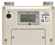
都市ガス用 スマートメーター ETK65SPR

コミュニティーガス(旧簡易ガス)・都市ガス いずれでも、選択約款で「新・料金メニュー」を 導入・運用頂いた実績があります。