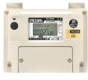
マイコンメーターE ETK25MTb PR