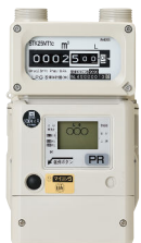
マイコンメーターS STK25MT1c PR