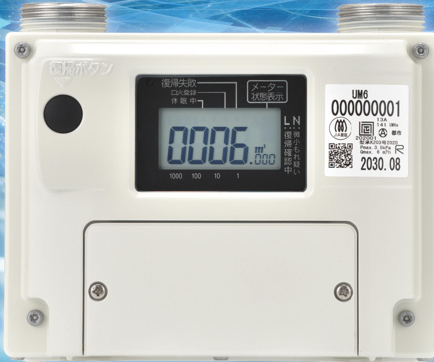
東洋計器の都市ガス版 スマートメーター 【地域都市ガス共通仕様】